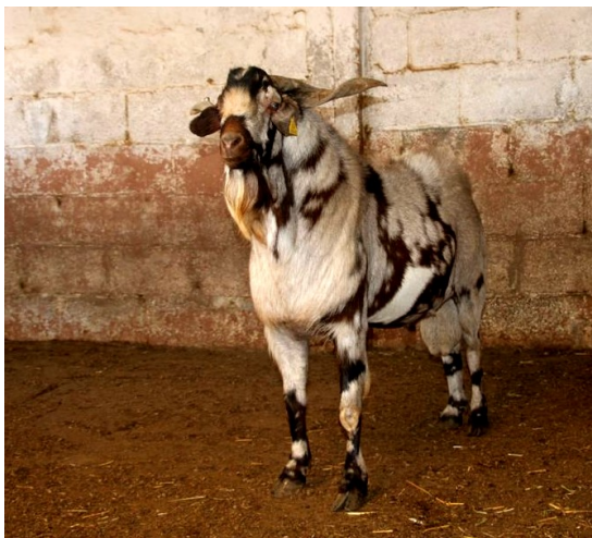
Semental de la raza caprina Majorera.

La cabra Majorera se encuentra perfectamente adaptada a zonas áridas y se mantiene en rebaños con un tamaño promedio de 500 a 600 animales.